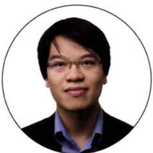
Le Quang Liem

Actual campion european și parte din top 10 cei mai buni jucători din lume, Vladislav Artemiev este cunoscut ca fiind cel mai bun jucător de șah sub 20 de ani din lume. În 2019 a obținut o victorie remarcabilă la Gibraltar Masters unde a avut un scor de 8\frac{1}{2}/10 , clasându-se în fața mai multor titani ai acestui sport. Tot în 2019, Vladislav Artemiev și-a făcut debutul în echipa Rusiei la Campionatului Mondial de Șah și a reușit să adune un scor de 6\frac{1}{2}/8 , ajutându-și echipa să obțină medalia de aur. Reușitele sale îl recomandă ca unul dintre cei mai promițători jucători ai momentului, cu o evoluție rapidă ce are potențialul de a influența rezultatele clasamentului final al Grand Chess Tour.