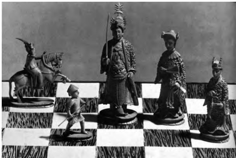
Șah chinezesc din fildeș (sec. XIX): cal, pion, rege, damă, nebun.

Istoria jocului de șah este încă plină de mistere. Cercetările făcute pe această temă nu au lămurit clar lucrurile. Au fost formulate mai multe ipoteze cu privire la locul unde a apărut acest străvechi joc: Grecia, Persia, China, Egiptul antic sau India.