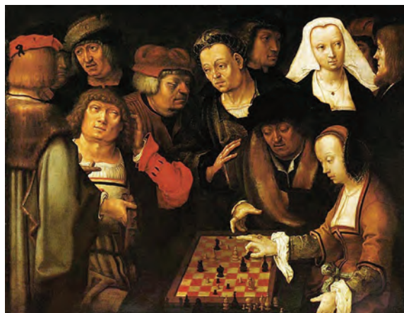
Celebrul tablou al pictorului renascentist Lucas van Leyden, intitulat Jucătorii de șah , cca. 1508, aflat în Muzeul Național din Berlin

Un rol important în această privință l-a avut papa Leon al X-lea (1513–1521), talentat practicant al jocului și, totodată, un asiduu organizator de turnee de șah. Exemplul său a fost urmat de numeroși nobili de la curțile regale, de înalți prelați ai epocii și chiar de clerici de rând. Această tradiție se va păstra și în secolele următoare.